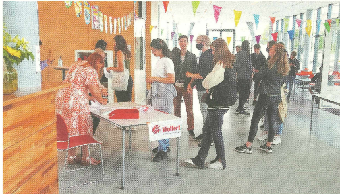
Geslaagde leerlingen in de rij bij het afhalen van cijferlijst en wimpel.

Bergschenhoek - Voor vrijwel alle 5 havo- en 6 vwo-leerlingen uit het eindexamenvak 2 van het Wolfert Lyceum in Bergschenhoek was vrijdag 2 juli een dag die niet snel in de vergetelheid verdwijnt. 's Ochtends kregen zij het van alle spanning bevrijdende telefoontje: Geslaagd! 's Middags konden zij hun cijferlijst en wimpel - voor aan de vlag-met-schooltas - afhalen. Op vrijdag 16 juli krijgen zij hun diploma uitgereikt.