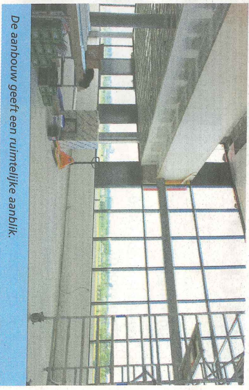
De aanbouw geeft een ruimtelijke aanblik.

Met een maquette van het huidige gebouw was bij de start goed te zien waar de uitbreiding ging plaatsvinden zonder de uitstraling van het pand aan te tasten: de brede kant (van de punt) ging op de tweede, derde en vierde verdieping verlengd worden. De aanbouw – die in een open verbinding met de huidige bouw staat – is gerealiseerd op