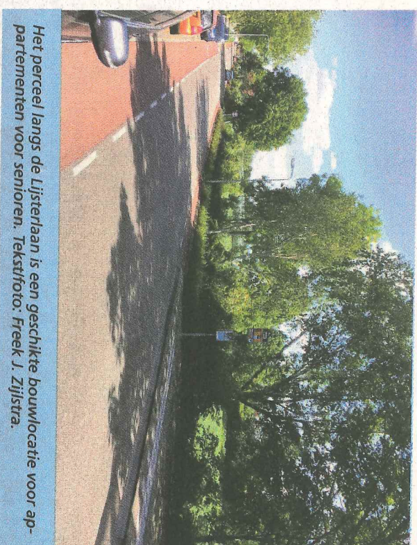
Het perceel langs de Lijsterlaan is een geschikte bouwlocatie voor appartementen voor senioren.