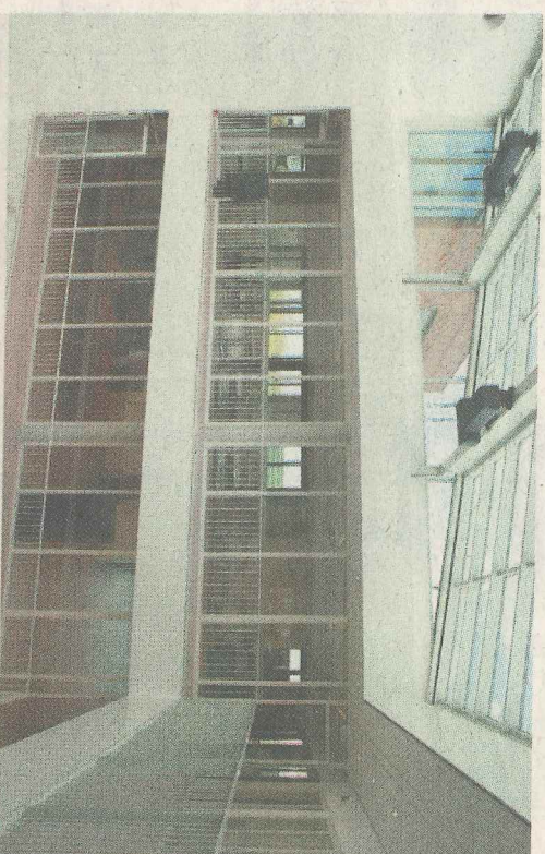
Veel licht en een atrium met daar omheen de lokalen met ruim licht en glas en herkenbare lokaalteksten daarop.