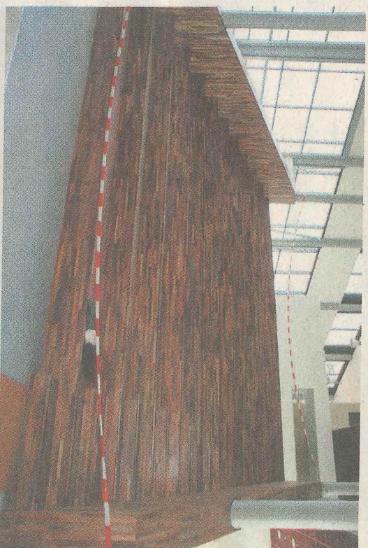
De fraaie houten trap bij de entree.