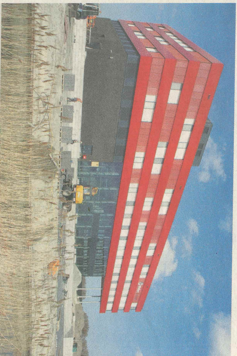
Het Wolfert Lyceum waar aan de voorzijde volop wordt gewerkt aan de afwerking van de bestrating.

De nieuwbouw van het Wolfert Dalton past helemaal bij het Dalton onderwijs-concept en tevens bij het scenario van Bergschenhoek.