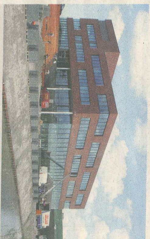
Terrij er nog flink gewerkt wordt rijden de verhuiswagens al af en aan bij het Melancthon Bergschenhoek.