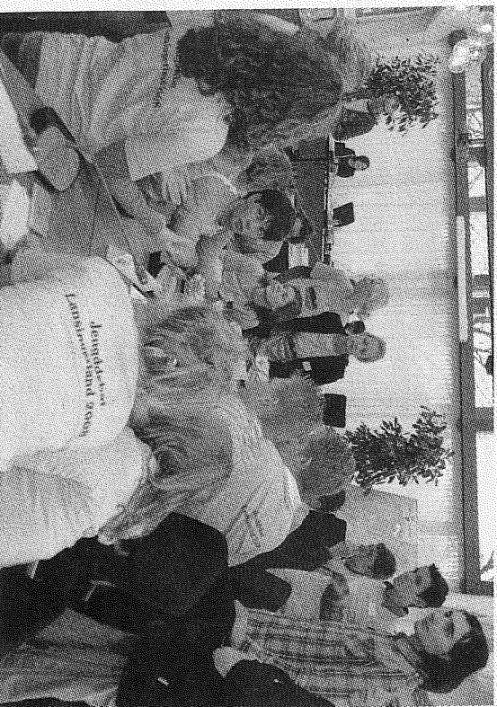
Er werd druk overlegd tijdens de schoorsingen.