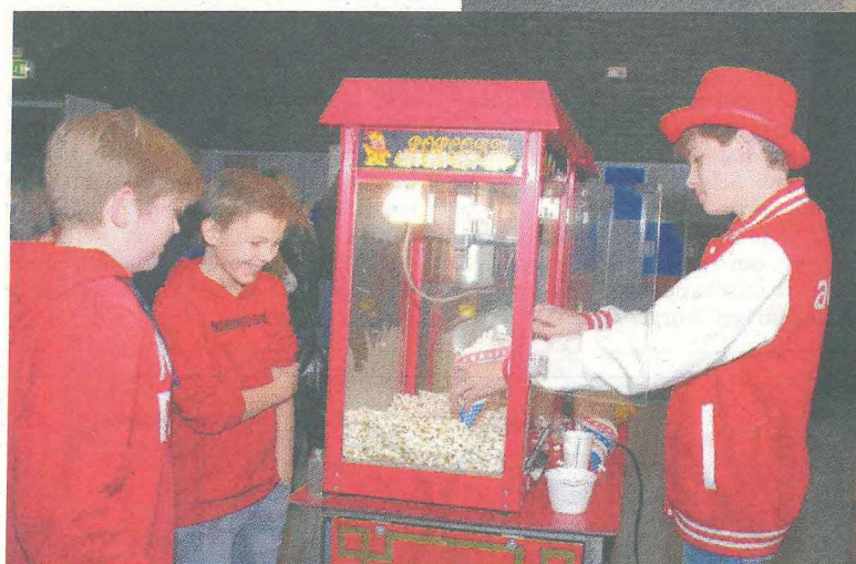
Warme en verse popcorn; met liefde bereid en bovendien in trek.

de begane grond. Op de eerste etage werden de workshops fotografie en pottenbakken aangeboden, op de tweede etage acteren voor de camera, jongleren, aftermovie en hiphop/breakdance en op de derde verdieping de workshops grimeren, DJ, handletteren, tekenen en schilderen en daar was ook de meet en greet met Jared Hiwat. Er stonden overal verspreid door de school kraampjes met eten en drinken en regelmatig was ook de grote trap een goed gevulde tribune als er op het toneel een voorstelling te bekijken was. Van de band Paem met daarin Pieter Metselaar die werkzaam is op het Wolfert Lyceum, maar ook van de docentenband die speciaal voor het WAF werd opgericht en een paar goede nummers liet horen. Applaus