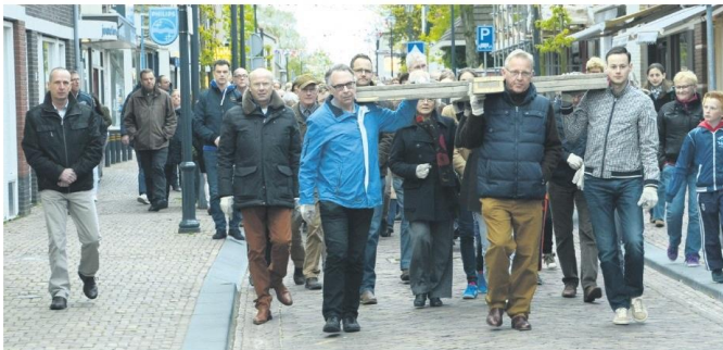
Het kruis wordt door de Dorpsstraat in Bleiswijk gedragen.

Bleiswijk - Het was een gedurfde onderneming, maar het is een groot succes geworden. Vrijdagavond 18 april - Goede Vrijdag - presenteerde het (gelegenheids) R.K. Middenkoor Lesito haar eigen The Passion in een bomvolle R.K.-kerk. Het was een gezamenlijk initiatief van de Gereformeerde kerk en de R.K. kerk in Bleiswijk.