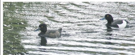
Bleiswijk - Ton Koorevaar uit Bleiswijk spotte deze week een paar kuifeenden in het water aan de Buizerstraat in zijn woonplaats. Deze eenden komen veel voor in het Noordpoolgebied en in ons land 's winters bij de Waddenzee en het IJsselmeer, aldus de fotograaf.