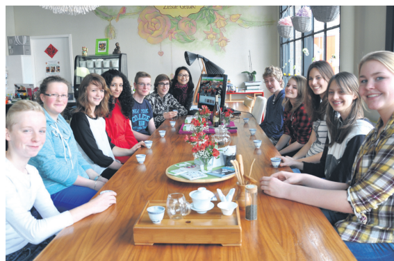
Ook een theeceremonie maakte deel uit van de kennismaking met de Chinese cultuur.

De open dag is van 12.00 tot 16.00 uur aan de Hoeksekade 164, Bergschenhoek.